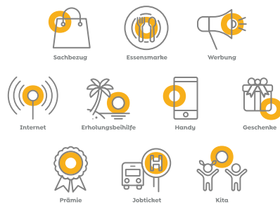
Die Lohnmodule von trebono